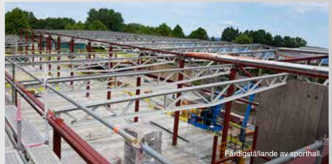
Färdigställande av sporthall.

Flera planerade renoveringar och en riktigt akut cisternreparation, det blev facit för 2019. Ett av de planerade projekten var en riktigt bjässe, 22 meter hög, en diameter på 19 meter och volym på 6000 m 3 . I projektet ingick design, konstruktion, tillverkning, demontering av gammalt och montage av nytt tak inklusive 1 meter av manteln på cisternen. Utöver detta skötte även Saltängen ytbehandlingen: både in- och utvändigt. Den akuta cisternrenoveringen å andra sidan bjöd på det mesta: leverans av 100 ton stål på 2 dagar; montage av vägg 240 kvm med tillhörande pelare, 12 meter långa HEA 360 balkar samt både nytillverkning och handpåläggning i vår verkstad i Norrköping. Allt löstes på 8 dagar, från beställning till färdigställande. Imponerande eller hur?