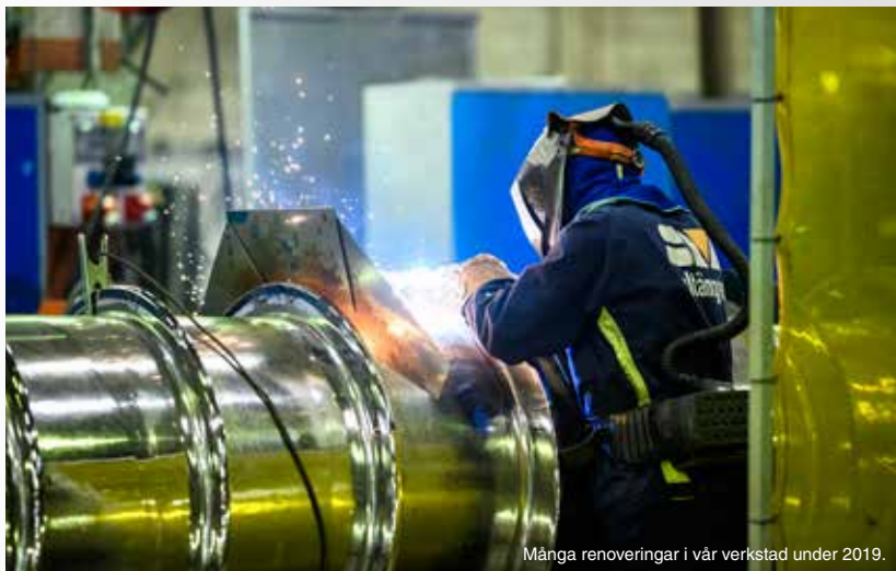
Många renoveringar i vår verkstad under 2019.