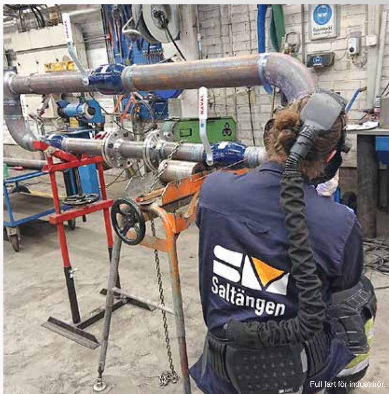
Full fart för industrirör.