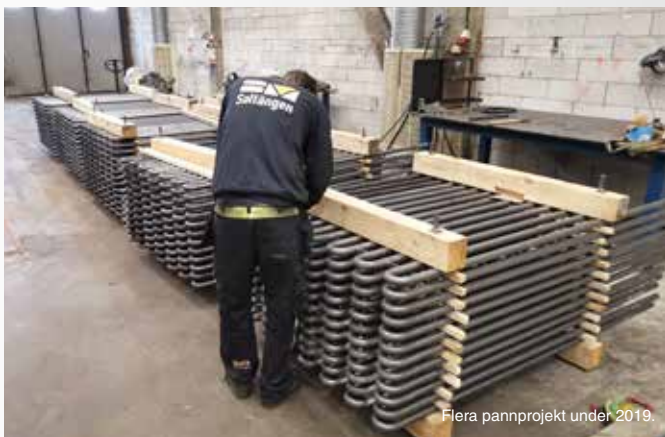
Flera pannprojekt under 2019.