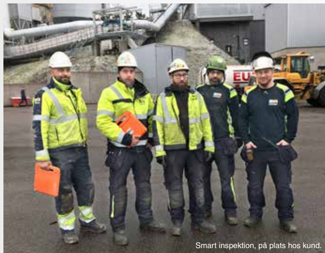
Smart inspektion, på plats hos kund.

2019 blev året då vi tog några rejäla kliv mot större åtaganden hos våra anläggningskunder. Ute på cement- och asfaltsanläggningar pågick under våren en mängd inspektioner, projekt och revisioner. Men det vi minns allra mest var underhållet av en 94 ton tung rotor hos en kund i Östra Sverige. I uppdraget ingick bortlyft av den 94 ton tunga gamla rotorn, förflyttning av remskivor, demontering och montering av plåt plus lyft och montage av ny rotor. Saltängen bistod även med flera unika tekniska förslag, som tex en lösning kring spännremmarna som håller drivhjulen på plats till rotorn. 2020 hoppas vi kunna hjälpa våra anläggningskunder ännu mer!