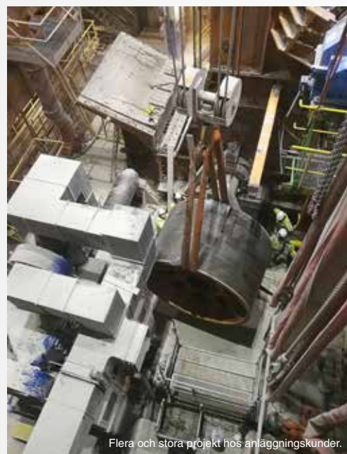
Flera och stora projekt hos anläggningskunder.