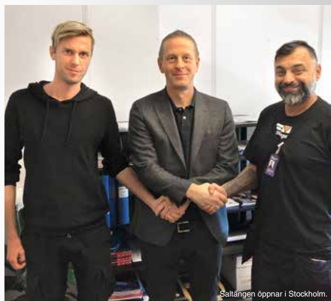
Saltängen öppnar i Stockholm.